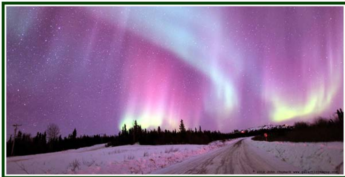
Imagem de uma Aurora Boreal no Alasca