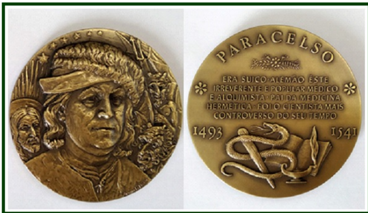
Medalha de bronze em homenagem a Paracelso, feita em Portugal (frente e verso).

Embora compartilhando as ilusões materialistas do seu tempo, a edição de 1967 da Enciclopédia Britânica faz algumas afirmações corretas no verbete sobre Paracelso.