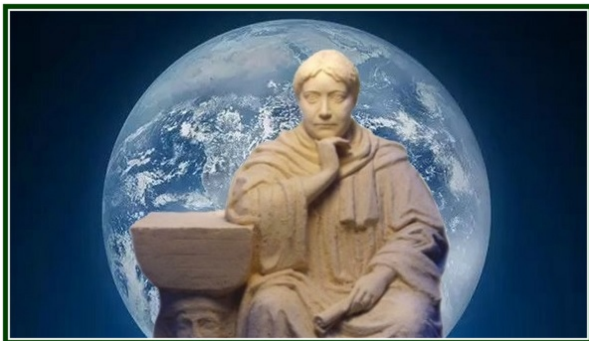
Estátua de Blavatsky, feita por Alexey Leonov, da Ucrânia

Com o avanço das comunicações eletrônicas, a partir do final dos anos 1990, criou-se a impressão, em certos meios, de que os estados nacionais deveriam desaparecer o antes possível.