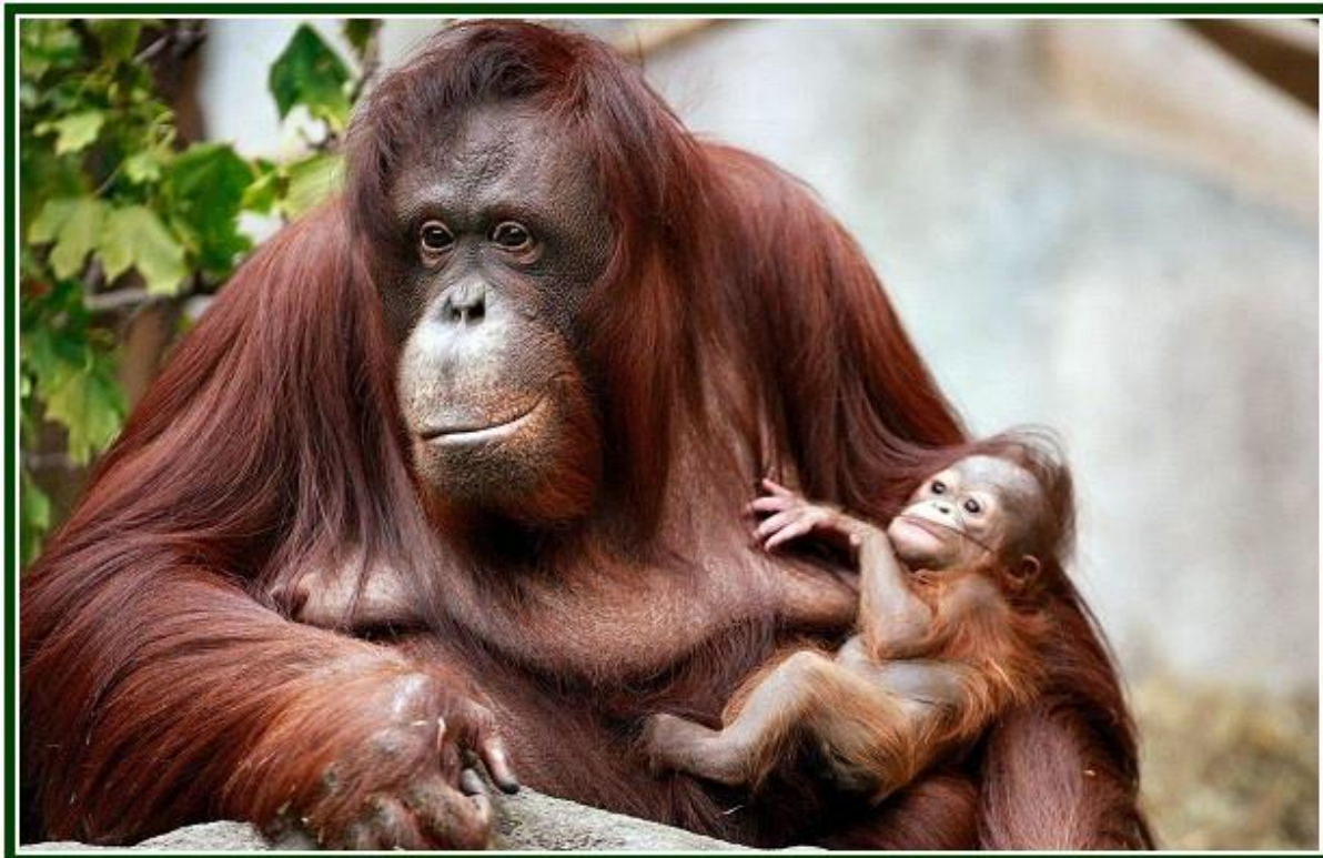
Мама орангутанг со своим малышом

Давайте на мгновение представим себе развоплощённого разумного орангутанга 1 или какую-нибудь африканскую человекообразную обезьяну, то есть лишённую своего физического тела, но обладающую астральным, если не бессмертным телом. Мы встречали в духовных журналах много случаев, когда люди видели призраков умерших любимых собак и других животных. Поэтому, основываясь на свидетельстве спиритуалистов, мы должны думать, что такие животные «духи» действительно появляются, хотя мы оставляем за собой право соглашаться с древними, что эти формы – всего лишь уловки элементалов. Однажды открыв дверь общения между земным и духовным миром, что мешает обезьяне производить физические феномены, такие как она видит производимыми духами людей? И почему их феномены не могут превзойти