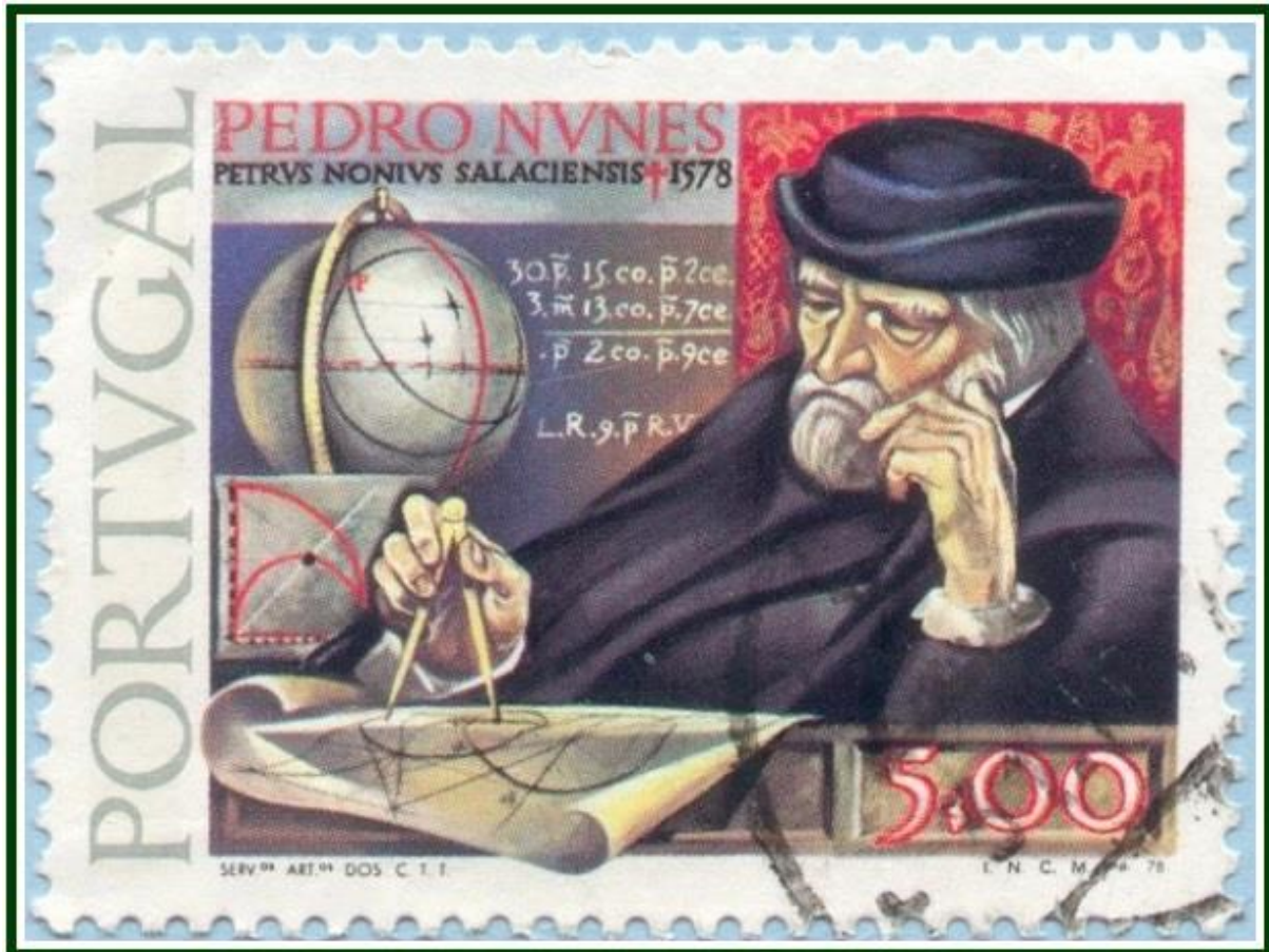
Pedro Nunes, em selo português de 1978

A nação portuguesa sofreu com a doença do antissemitismo, mas também possui uma longa tradição humanista. De origem presumivelmente judaica, Pedro Nunes foi apoiado pelo trono do seu país até completar sua encarnação, em 11 de agosto de 1578, e sua memória continuou a ser respeitada desde então. Por outro lado, é pouco conhecido o fato de que Pedro Nunes foi membro destacado de uma fraternidade internacional de cientistas e místicos.