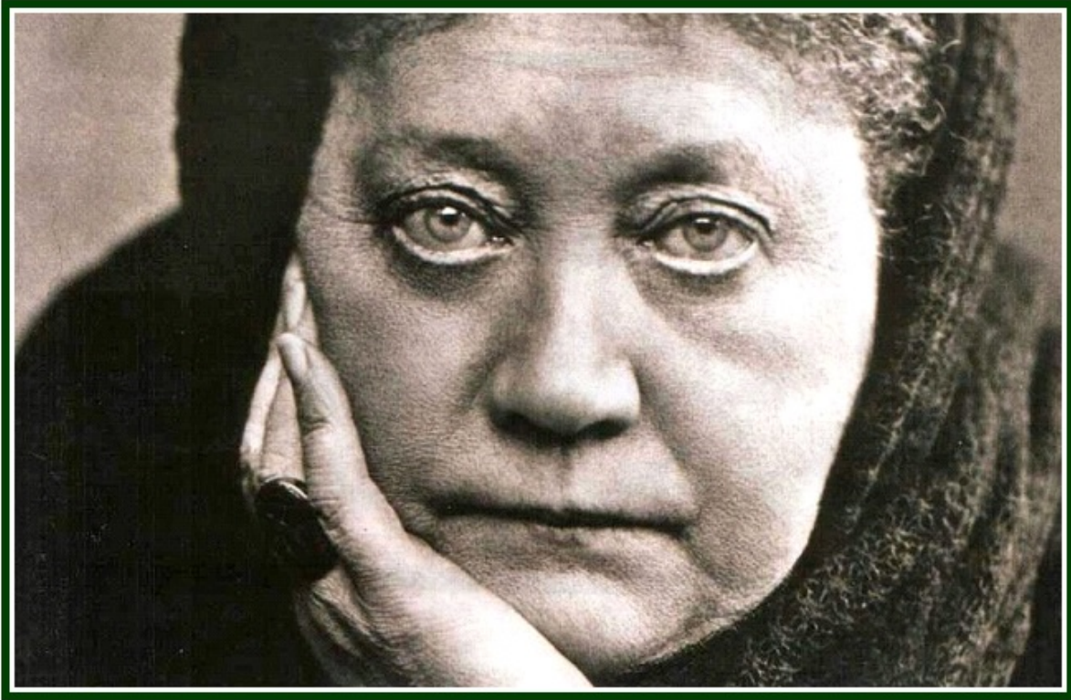
H.P. Blavatsky (1831-1891)

Almas ingênuas costumam dizer, como se fosse uma verdade inquestionável, que “a Teosofia nada tem a ver com questões sociais ou políticas”.