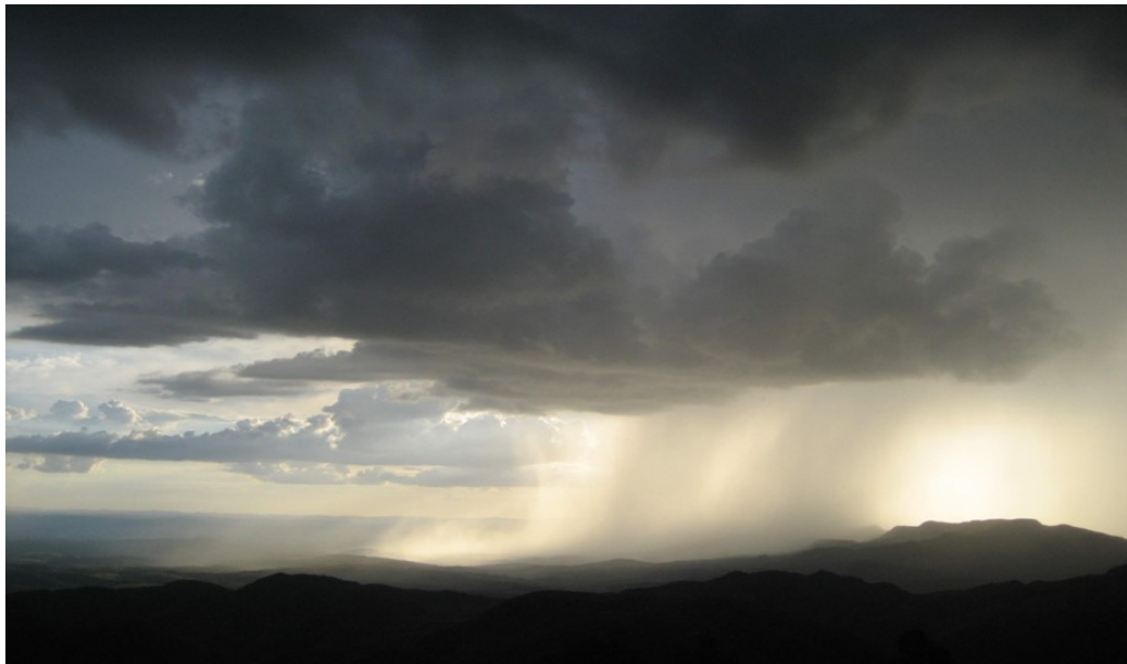
Hidrocentrismo: o ciclo da água como o princípio organizador da vida

“Somos poeira de estrelas” - celebramos com Carl Sagan. Mas também somos água de cometas, lágrimas de mundos que explodiram para que pudéssemos, um dia, chorar. Somos poeira incandescente e orvalho gelado, contradição que aprendeu a fluir.