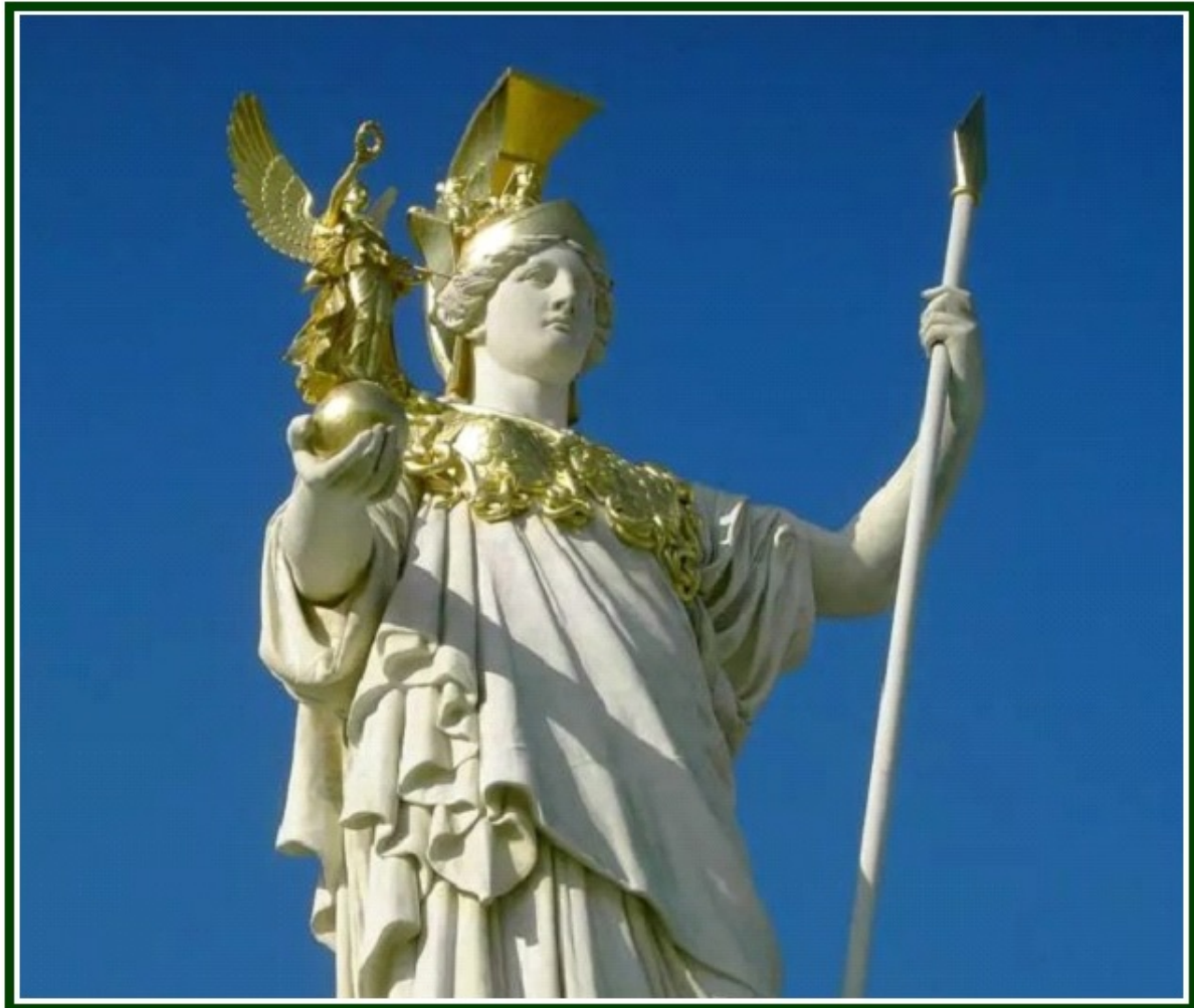
Uma estátua dedicada à deusa grega da Vitória, Nike.