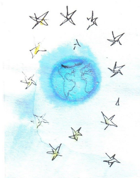
Água no planeta e no cosmos. Autora: Maria Helena Andrés.