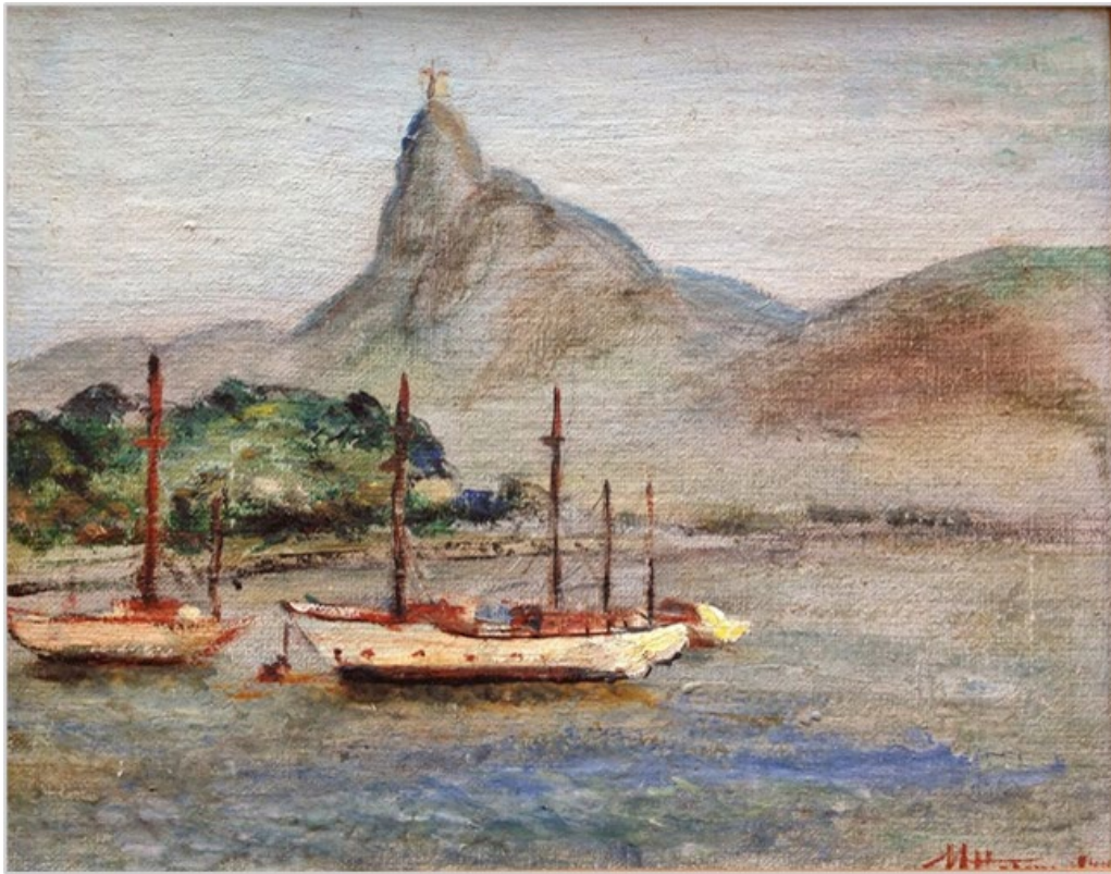
A arte e a água. O primeiro barco. Pintura de Maria Helena Andrés, Rio de Janeiro. 1946.