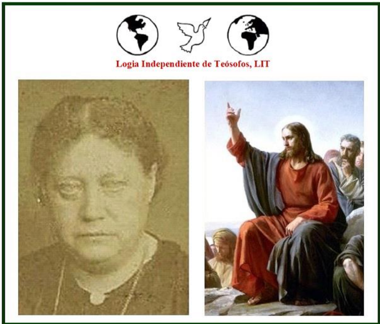
Helena Blavatsky (1831-1891) y una imagen de Jesús predicando

Hay un Puente de Pensamiento Lúcido Entre el Ideal Cristiano y la Teosofía Clásica